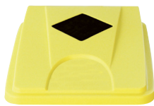
OUVERTURE : 10,5 X 10,5 CM 8 99 1102

TYPE DE COUVERCLES DISPONIBLES POUR COLLECTEURS TRI SÉLECTIF 60 ET 80 L