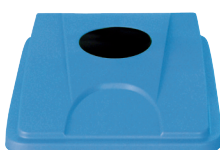
OUVERTURE : Ø 12 CM 8 99 1101