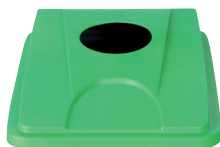
OUVERTURE : Ø 12 CM 8 99 1100