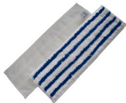
Réf. 615.540.540: Mop grattant 44 x 13 cm blanc/bleu